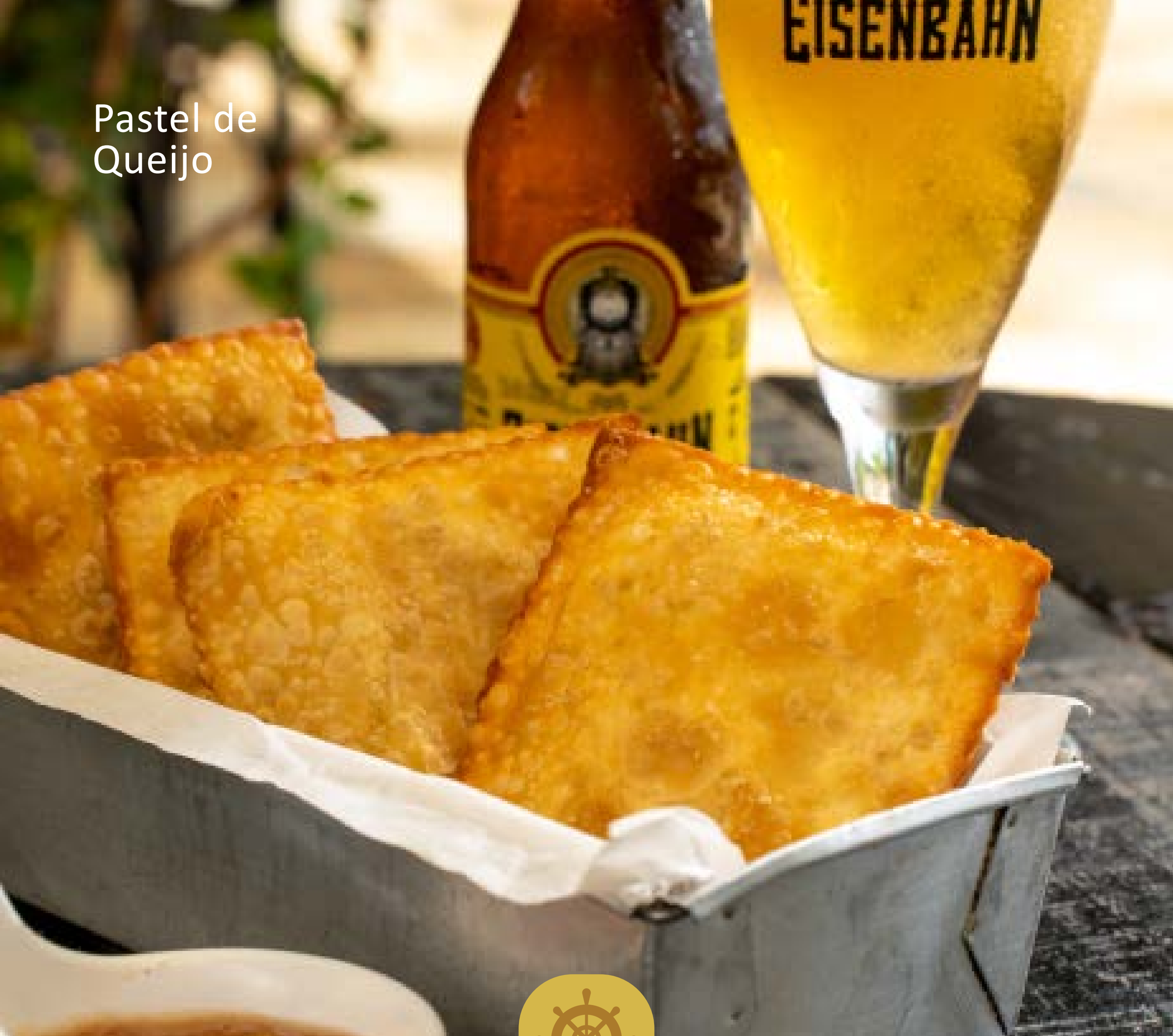
Pastel de Queijo