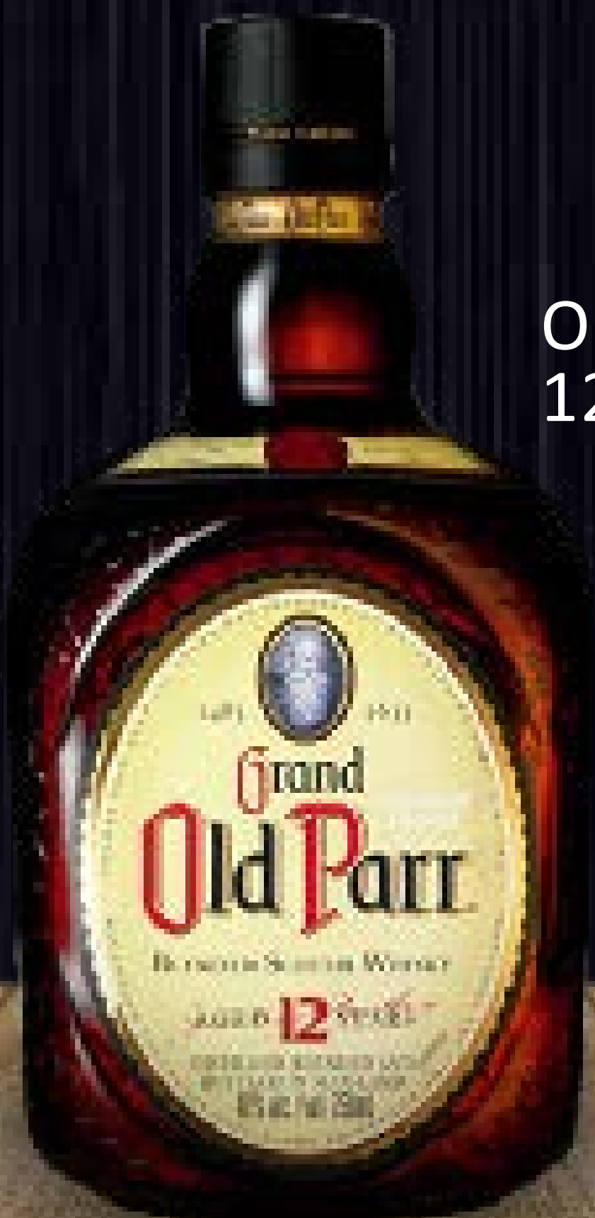
Old Parr 12 anos