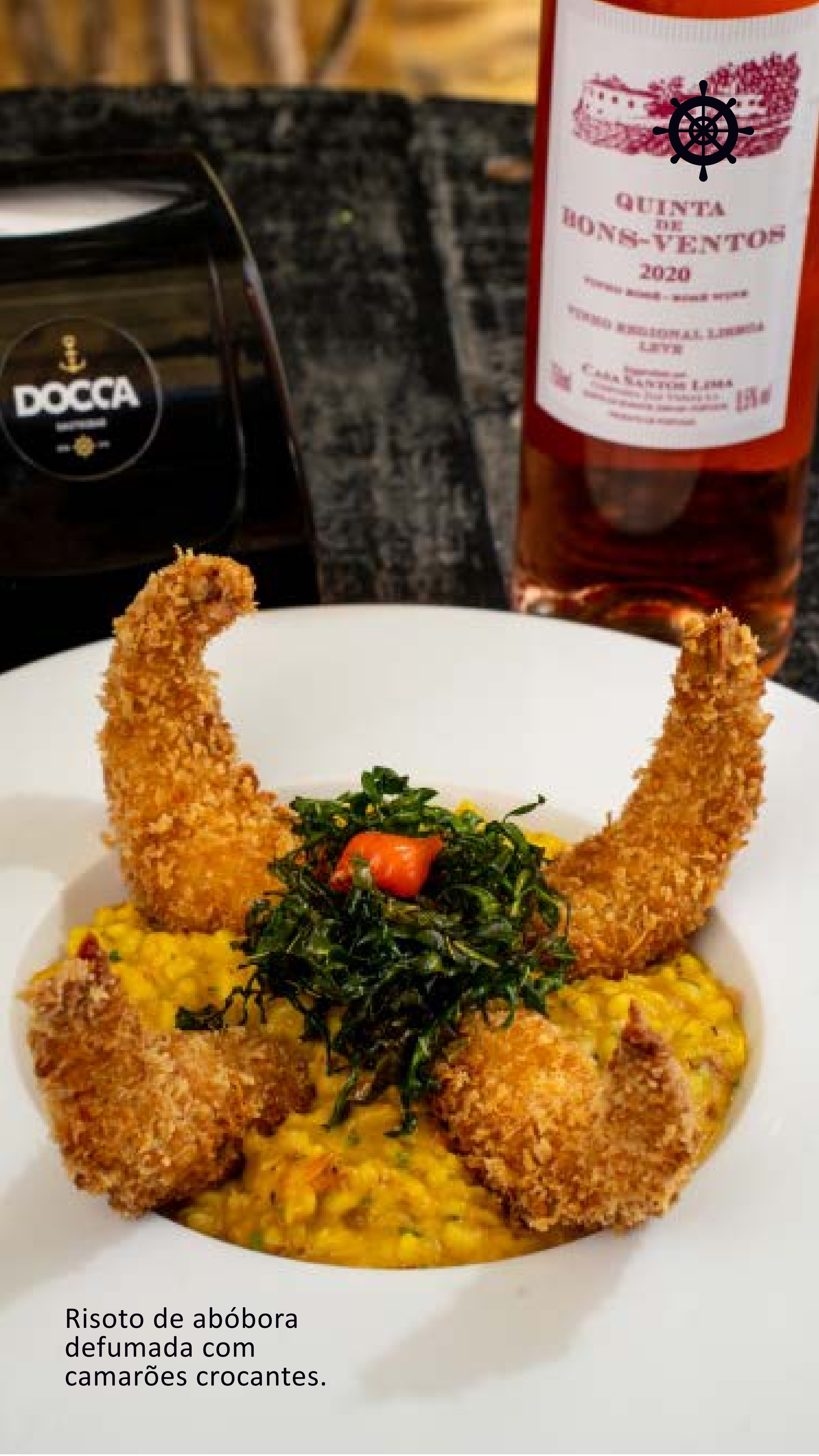
Risoto de abóbora defumada com camarões crocantes.