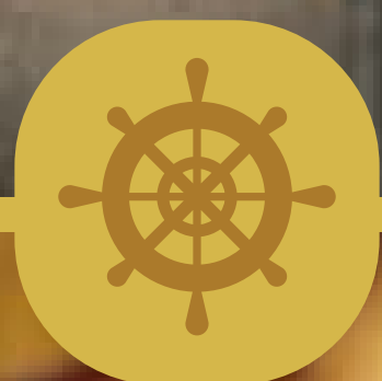
Tartar de Salmão